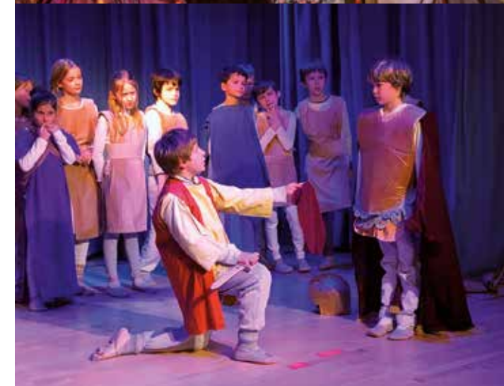
Le théâtre est un art pédagogique fondamental au croisement de tous les autres arts.