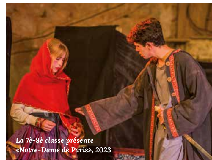
La 7è-8è classe présente «Notre-Dame de Paris», 2023

Une partie des travaux prendrait la forme de chantiers participatifs. L'école Christophorus de Hambourg, avec laquelle l'École de La Mhotte est jumelée, prévoit déjà quant à elle de construire une scène et des gradins modulables.