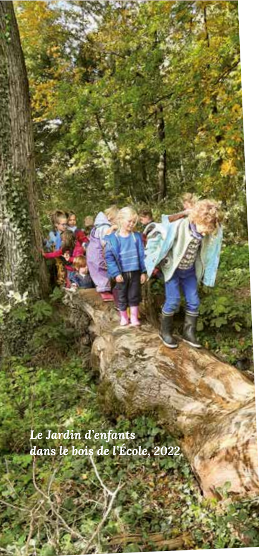
Le Jardin d’enfants dans le bois de l’École, 2022.

“L’enracinement est peut-être le besoin le plus important et le plus méconnu de l’âme humaine. (...) Un être humain a une racine par sa participation réelle, active et naturelle à l’existence d’une collectivité qui conserve vivants certains trésors du passé et certains pressentiments d’avenir.” Simone Weil