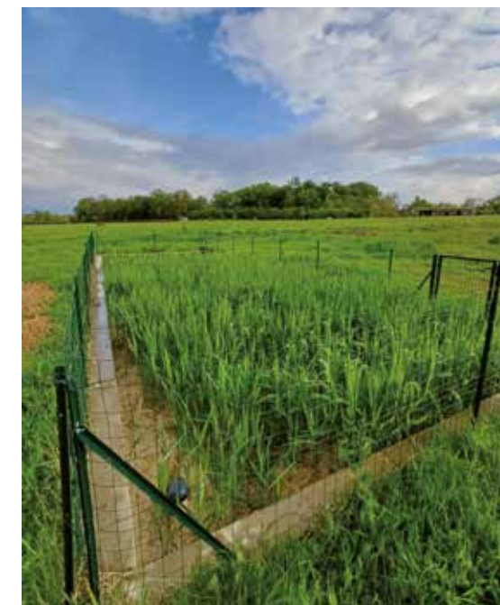
La phyto-épuration, qui a fait ses preuves, s'appuie sur l'action conjointe des plantes et des micro-organismes présents dans le sol (ici à la Ferme de la Mhotte).

Plusieurs études et devis ont déjà été réalisés à cet effet et des considérations à la fois économiques et écologiques convergent en faveur d'un assainissement par phytoépuration, ou par les plantes, qui est une technique efficace, naturelle et nécessitant peu d'entretien. Les réseaux de collecte et le bassin de filtration de l'École et de l'habitat participatif seront mutualisés, ce qui aura pour intérêt de réduire l'emprise au sol et les coûts de l'installation. Ce système d'assainissement est déjà en place à la Ferme de la Mhotte.