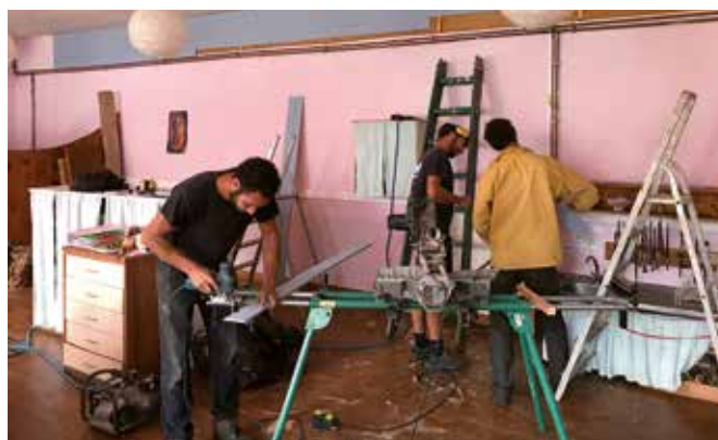
Un chantier d'isolation réalisé par les parents au Jardin d'enfants en 2022.

Les bâtiments préfabriqués qui accueillent les enfants, construits après-guerre, présentent en effet des signes de vétusté importants. Les investissements nécessaires à leur amélioration tant structurelle qu'énergétique vont désormais pouvoir être envisagés de manière plus sereine. C'est ainsi qu'un programme de réfection des toitures a été engagé à l'été 2024. Des réflexions sont également menées sur le réaménagement du château. Dans tous les cas, ces développements conséquents prendront du temps et seront échelonnés, la nature et les enjeux d'une école indépendante appelant à agir avec circonspection.