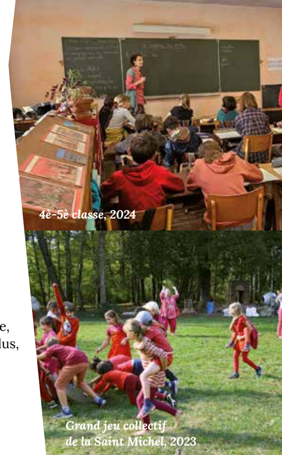
4 e -5 e classe, 2024

une ouverture aux autres : l'autre est unique, à la fois semblable et différent. La découverte de l'autre et le chemin vers l'autre s'apprennent tous les jours au travers des cours, des activités, des projets communs. L'altérité s'éprouve encore d'une autre manière auprès d'élèves, d'étudiants, de volontaires et de familles arrivant de pays étrangers ou lorsque nos élèves vont eux-mêmes séjourner à l'étranger, en groupe ou en individuel. Des partenariats avec des écoles européennes sont installés.