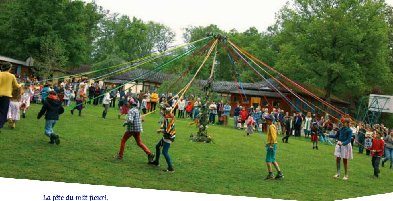
La fête du mât fleuri, mai 2023