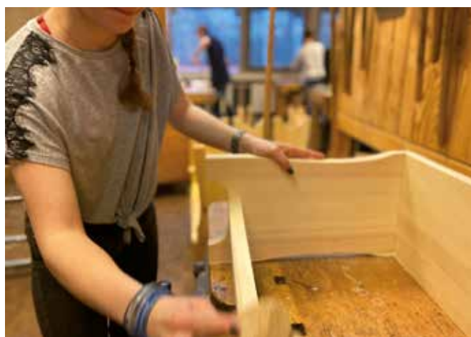
Les élèves et les professeurs de l'école Christophorus de Hambourg qui ont déjà donné une énergie précieuse à l'École, contribueront au projet de développement dans le cadre du prochain chantier commun prévu au printemps 2026.